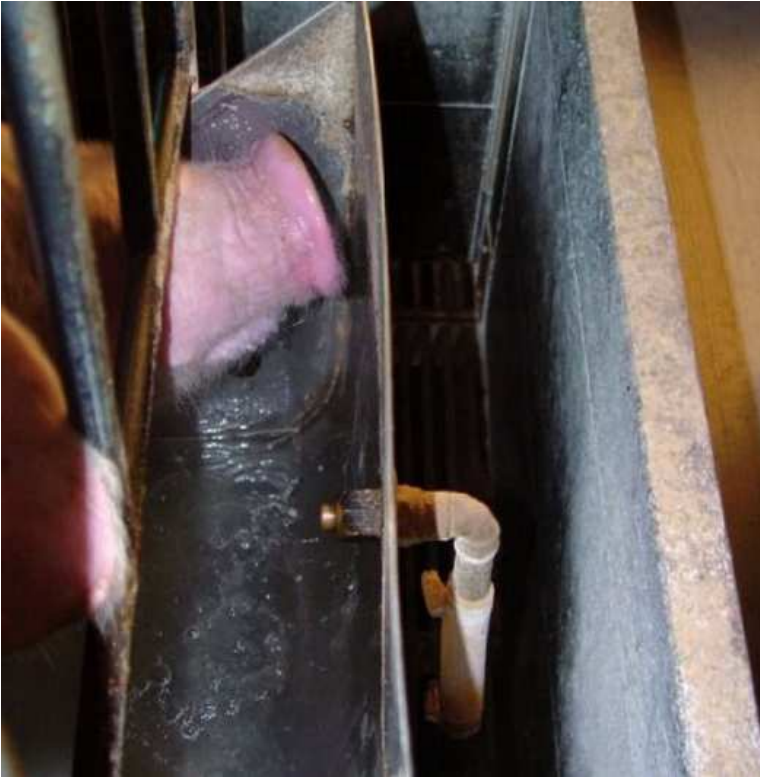
Bebedero de nivel constante