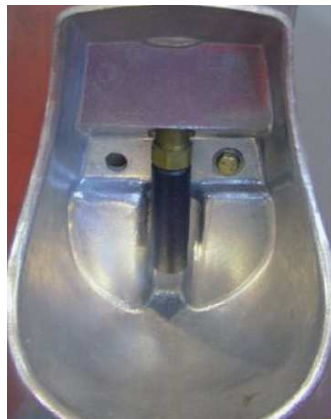
Bebedero de cazoleta